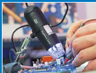
Onderhoud, reparatie en kalibratie