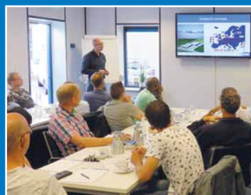
Cursussen en workshops