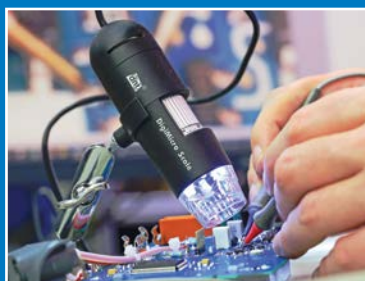
Onderhoud, reparatie en kalibratie